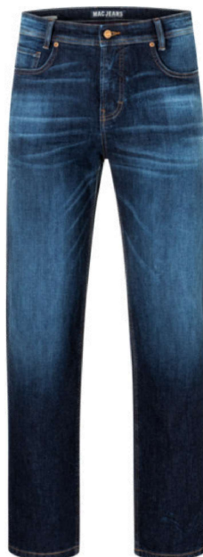
0431-00-1982L H691 dark blue authentic 3D use