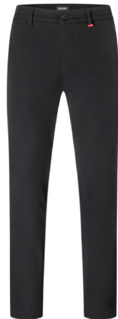
6000-00-0737L P090 power black