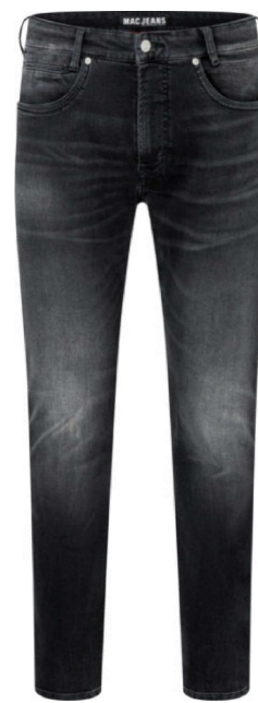
0517-00-1973L H996 black black authentic use