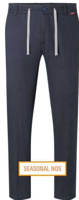
6336-00-0651L 250 clay