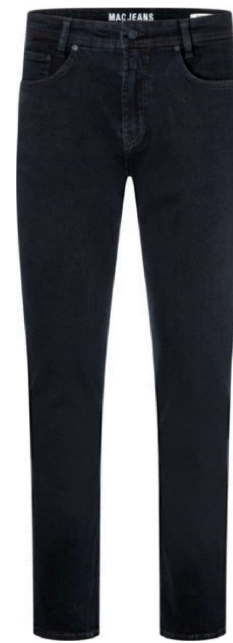
0518-01-1995L H799 blue black