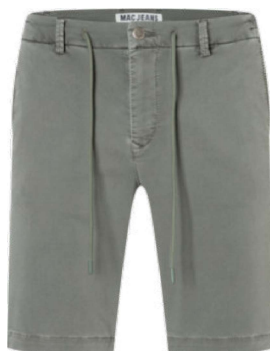
6691-PP-0993L 656W leaf green