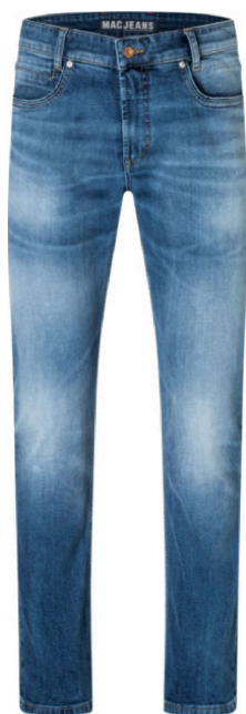
0517-00-1973L H545 history blue used