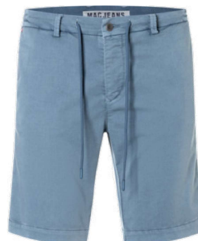
6691-PP-0993L 122W blue mirage