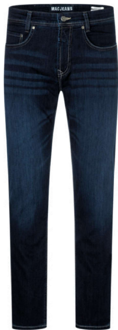
0590-00-0994L H743 dark blue authentic used