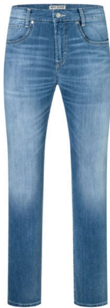
0517-00-0951L H250 light blue authentic wash