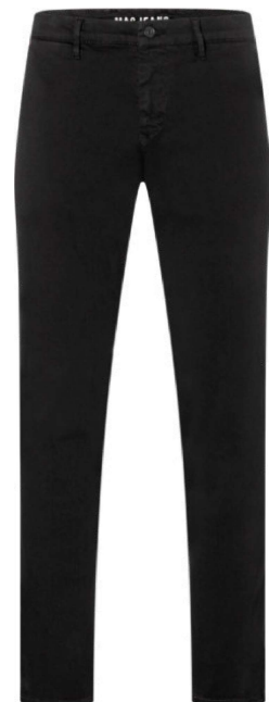
6351-00-1995L 090W black