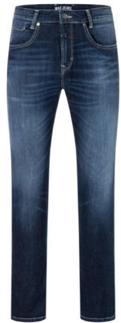
0517-00-0951L H680 deep blue authentic wash