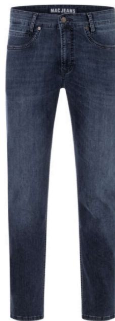
0517-00-0951L H792 deep blue od grey