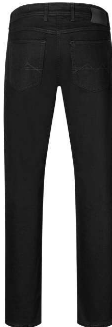
0501-00-0971L H900 stay black black