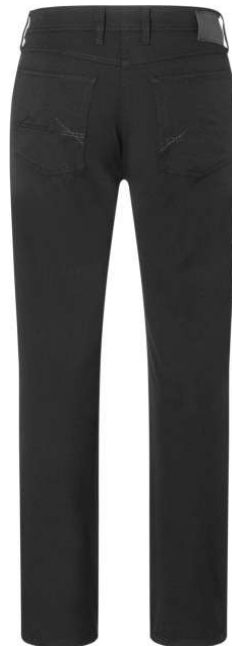
0501-00-0737L P090 power black