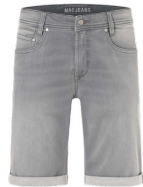
0562-00-0994L H815 light summer grey