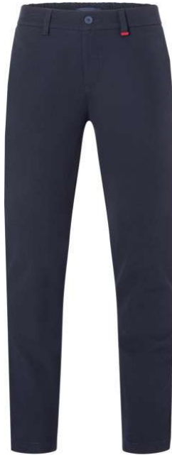
6000-00-0737L 199 midnight blue