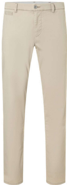
6332-91-0678L 214B smoothly beige printed