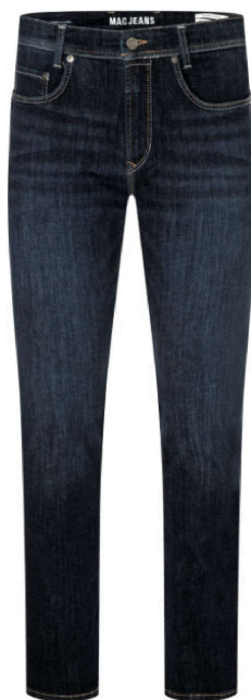
0518-01-1995L H736 rinsed wash 3D