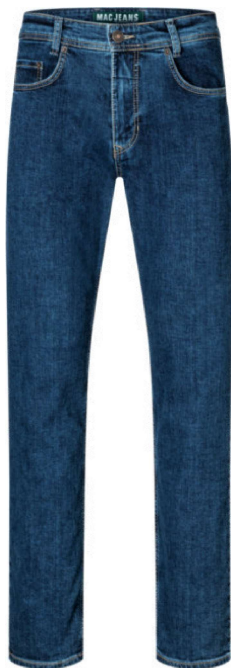
0501-00-0970L H510 blue light used