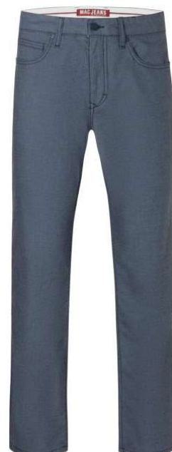
0600-92-0607L 199 midnight blue