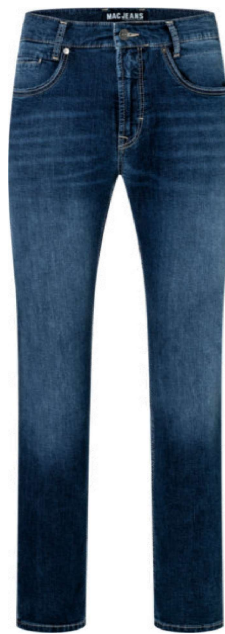
0517-00-0951L H430 mid blue authentic used