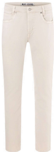
0517-PP-0951L 211W kitt