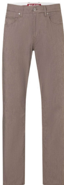
0600-92-0607L 297 hot fudge