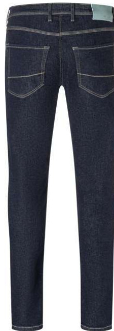
0518-06-1995L H951 ever blue