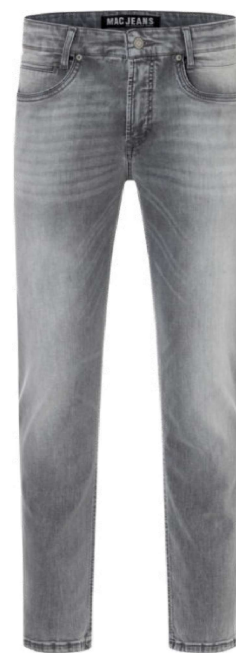
0517-00-1973L H813 authentic summer grey