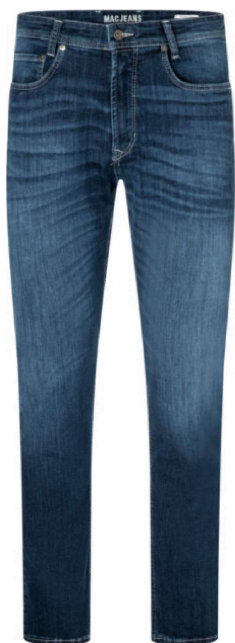
0518-01-1995L H559 deep blue vintage wash