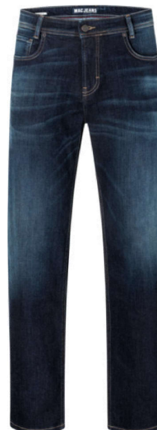
0431-00-1982L H752 dark blue authentic used