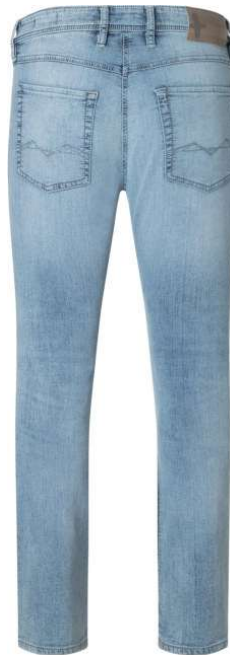
0518-01-1991L H243 authentic sky blue