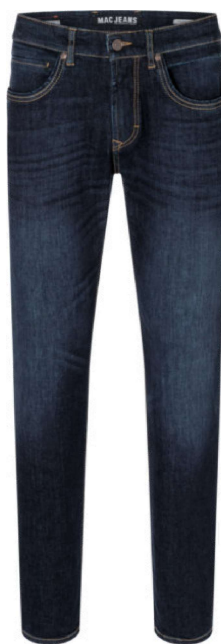
0517-00-1973L H781 dark blue authentic used