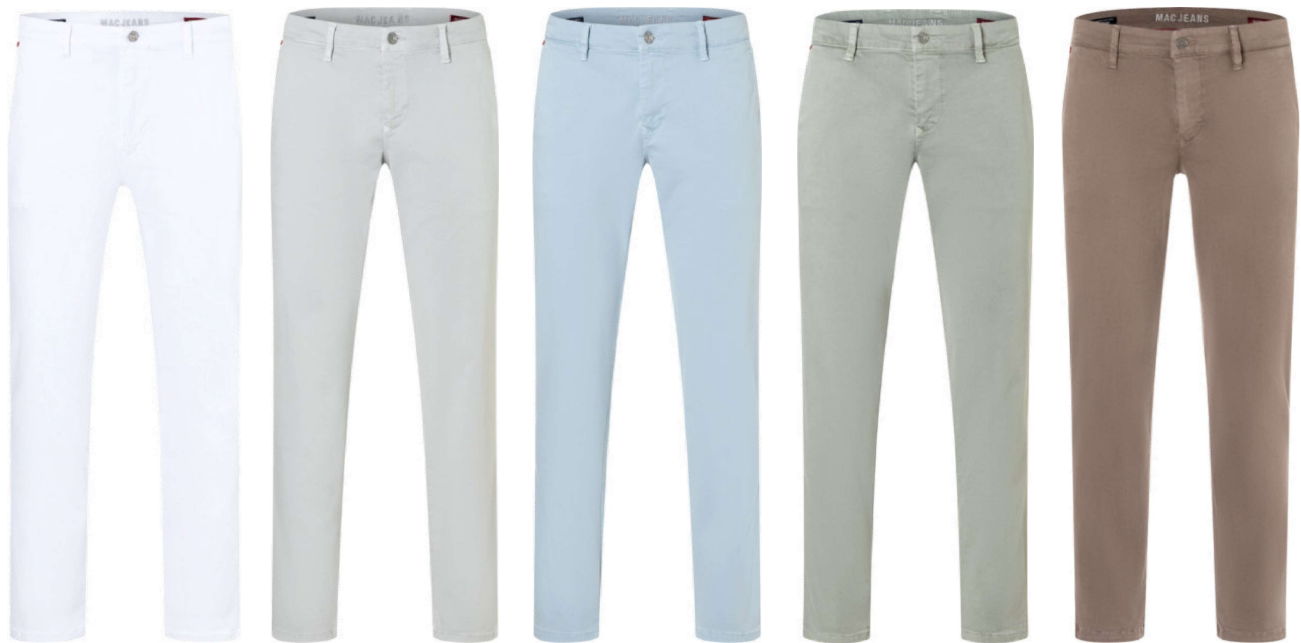
6351-21-1995L H010 white denim