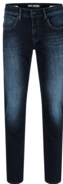
0517-00-1973L H793 blue black 3D authentic