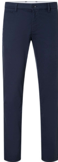
6332-91-0678L 186B dark indigo printed