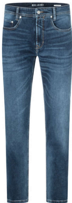
0590-00-0994L H757 nightblue authentic wash