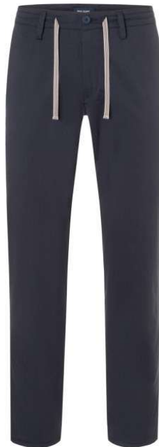
6550-01-0702L 199 midnight blue