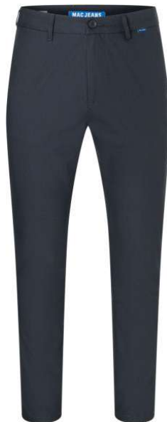
6617-00-0705L 196 nautic blue