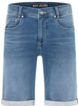
0562-00-0994L H245 summer blue used authenti