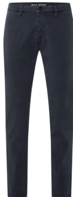
6351-00-1995L 199W midnight blue