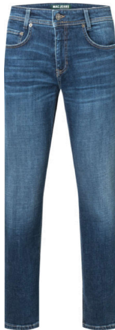
0501-00-0970L H690 dark blue authentic 3D