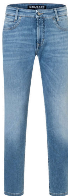
0517-00-1973L H291 light blue authentic wash