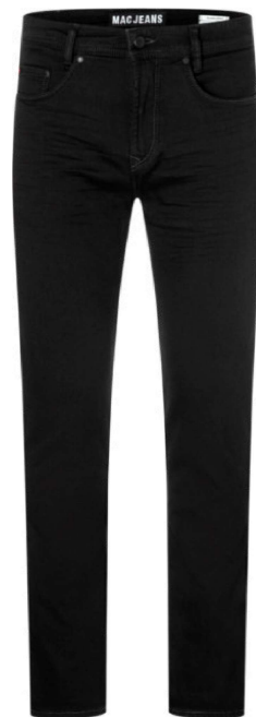
0590-00-0994L H896 black black clean