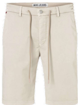
6691-PP-0993L 214W smoothly beige