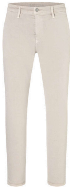
6351-00-1995L 211W kitt