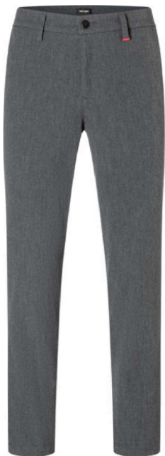
6000-00-0737L 077 grey stone