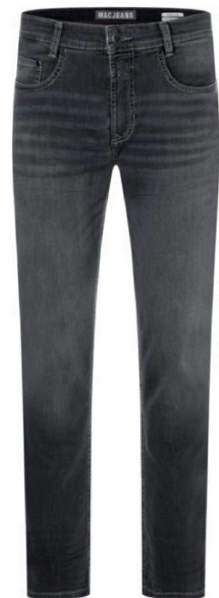
0590-00-0994L H830 grey used