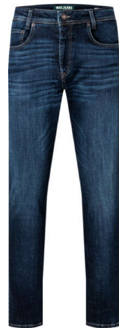
0501-00-0970L H768 dark vintage blue