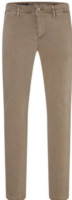
6351-00-1995L 267W dune