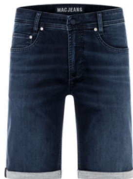
0562-00-0994L H694 dark blue vintage wash