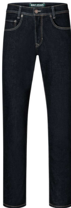
0501-00-0970L H750 authentic dark blue