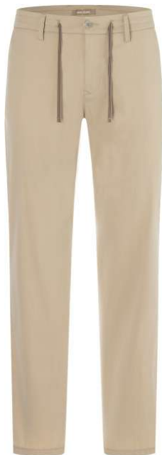
6550-01-0702L 214 smoothly beige