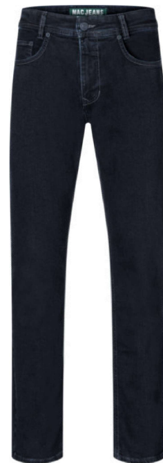
0501-21-0970L H799 blue black