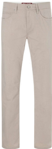
0600-92-0607L 214 smoothly beige