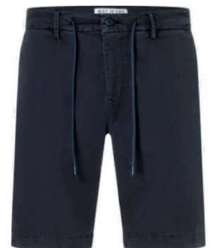
6691-PP-0993L 199W midnight blue