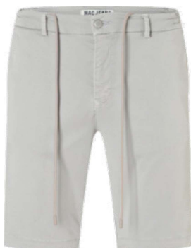
6691-PP-0993L 209W fog