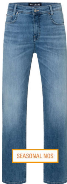
0431-00-1982L H331 vintage summer blue