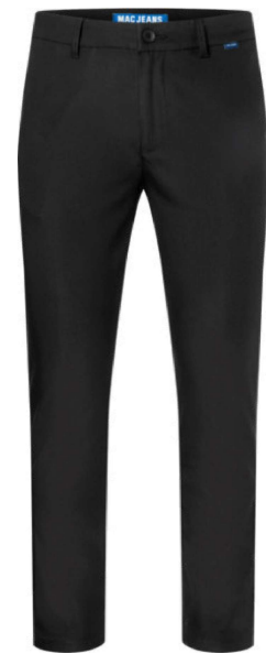
6617-00-0705L 090 black