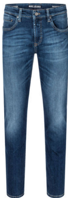
0517-00-1973L H662 old legend wash