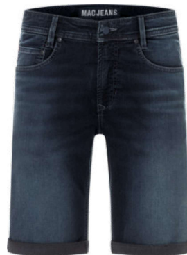
0562-00-0994L H791 deep blue od black